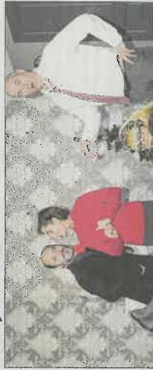
Le Zèbre, 24 avenue de la République à Arcachon. Pensez à réserver au 06.85.96.59.87